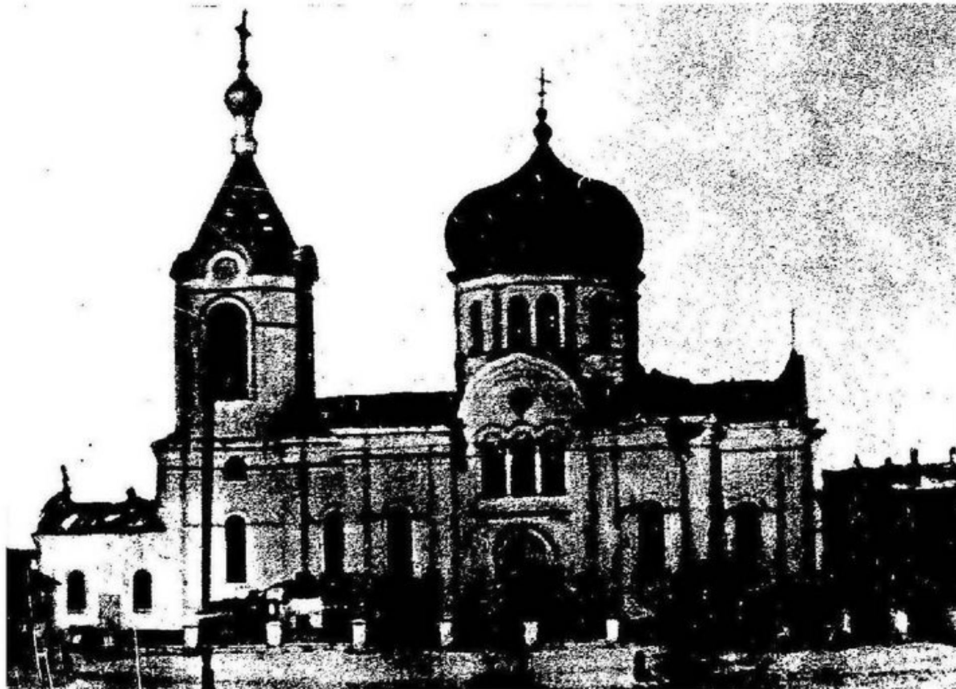
Спасо-Преображенский собор в Орске (здание не сохранилось) Постройка 1851 года

Казачи Орской станицы широко отмечали Масленицу и войсковой праздник 23 апреля (ст. ст.) разными играми, весельем, песнями и т.д.